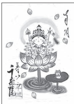
②特別ご朱印 (夏限定6、7、8月)