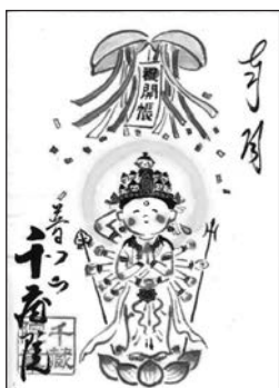
③ご開帳ご朱印 (8/9、10のみ)